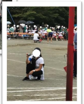
運動会など行事では PTA広報の腕章を付けて、 広報に載せるための写真撮影